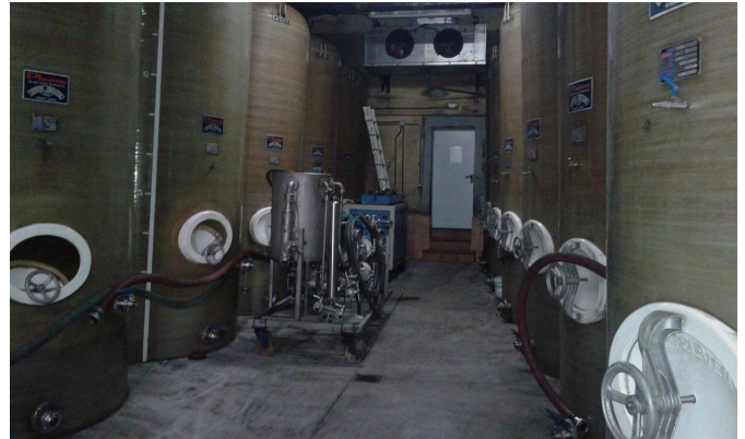
Interior del Llagar