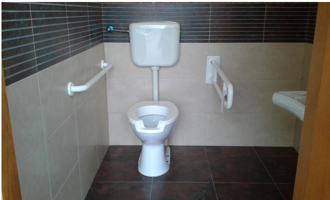
Cabina aseo adaptado