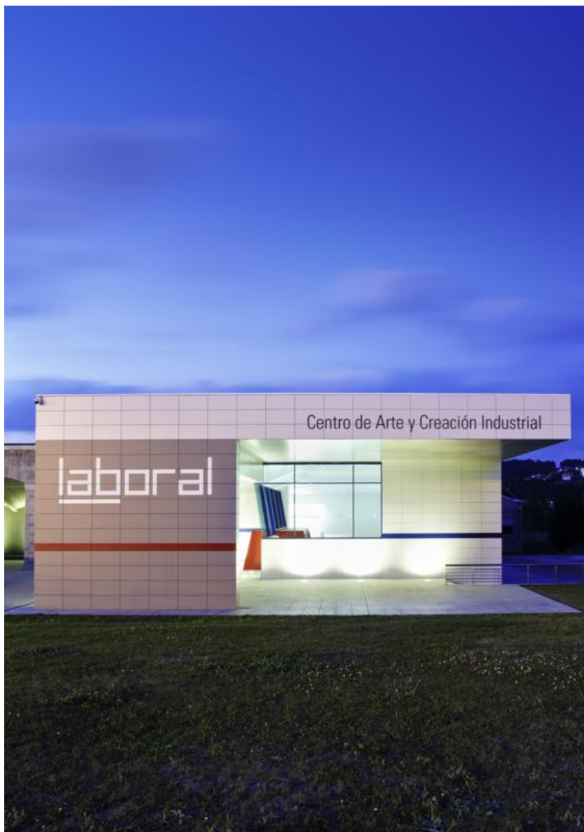
Fachada del Centro