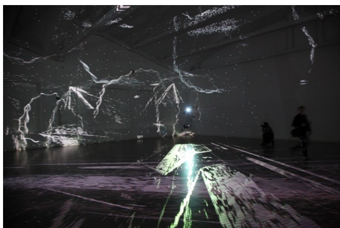
Sala de exposiciones