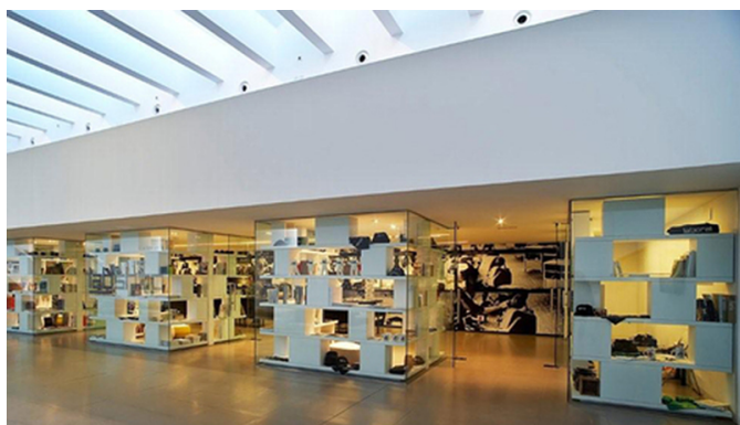
Interior y exposición